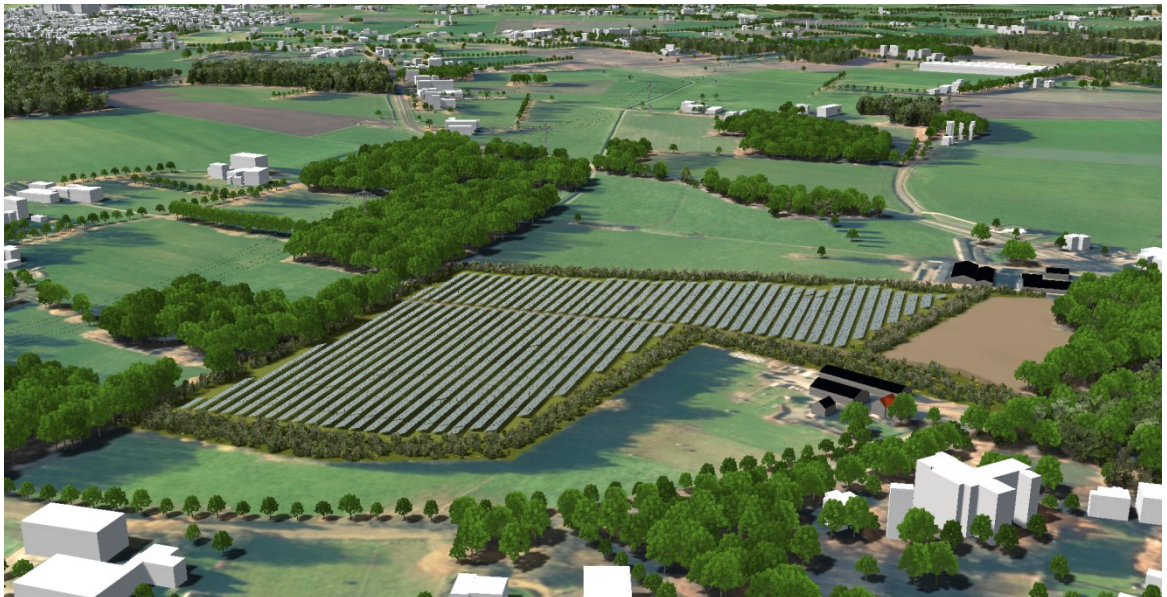
3D impressie zonnepark Herike – Elsen

1.1 Wij stellen u voor geen exploitatieplan vast te laten stellen omdat het verhaal van de kosten van de grondexploitatie over de in het plan begrepen gronden anderszins is verzekerd. De kosten voor het aanpassen van het bestemmingsplan zijn betaald door de initiatiefnemer.