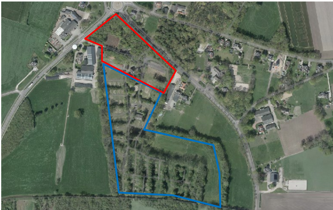
Luchtfoto plangebied zonnepark (blauw), voorterrein (rood)

De buurtschap heeft zich verenigt in de “Coöperatief Buurtschap Herike-Elsen UA” hiermee willen de buurtschap proberen om de 2 ha van het voorterrein over te nemen van de huidige eigenaar Powerfield. En daarnaast wil de buurt ook 2 ha van het 8 ha grootte zonnepark overnemen. De onderhandelingen hierover zijn nog in volle gang. Om de mogelijkheden van een AZC terrein weg te nemen en de gewenste gebruiksmogelijkheden toe te staan, is een bestemmingsplanherziening noodzakelijk. Dit bestemmingsplan voorziet hierin.