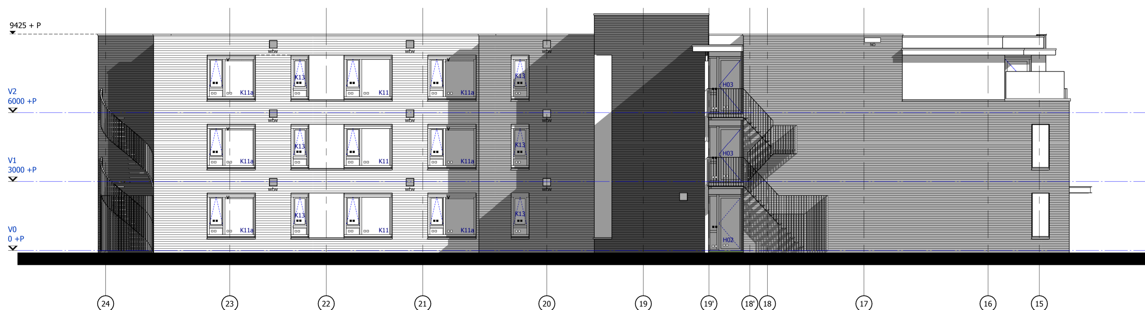
Gebouw A, Achtergevel